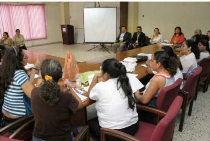
Viceministro de Agricultura y Ganadería, Lic. Hugo Flores, escucha propuestas de representantes de la mesa de mujeres rurales.

Para lograr impulsar el trabajo del Ministerio de Agricultura y Ganadería con el PAF, el Sr. Viceministro, Lic. Hugo Alexander Flores, sostuvo una reunión con las representantes de comunidades de mujeres de todo el país, donde escuchó las propuestas de trabajo para la mesa de diálogo con diferentes proyectos agropecuarios.